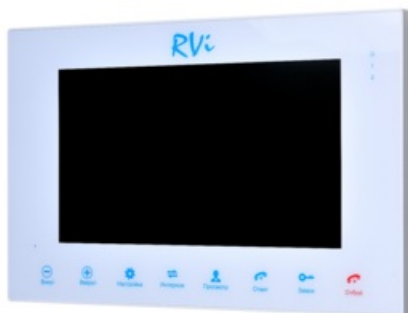
Фото Домофон RVI RVI-VD10-11(белый)

Тел: +7 495 414-25-80 | Email: sale@ru-rvi.com | https://ru-rvi.com