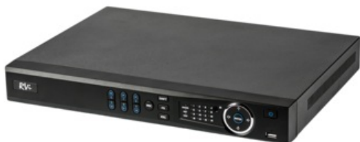
Фото IP-видеорегистратор RVI RVI-IPN32/2L

Тел: +7 495 414-25-80 | Email: sale@ru-rvi.com | https://ru-rvi.com