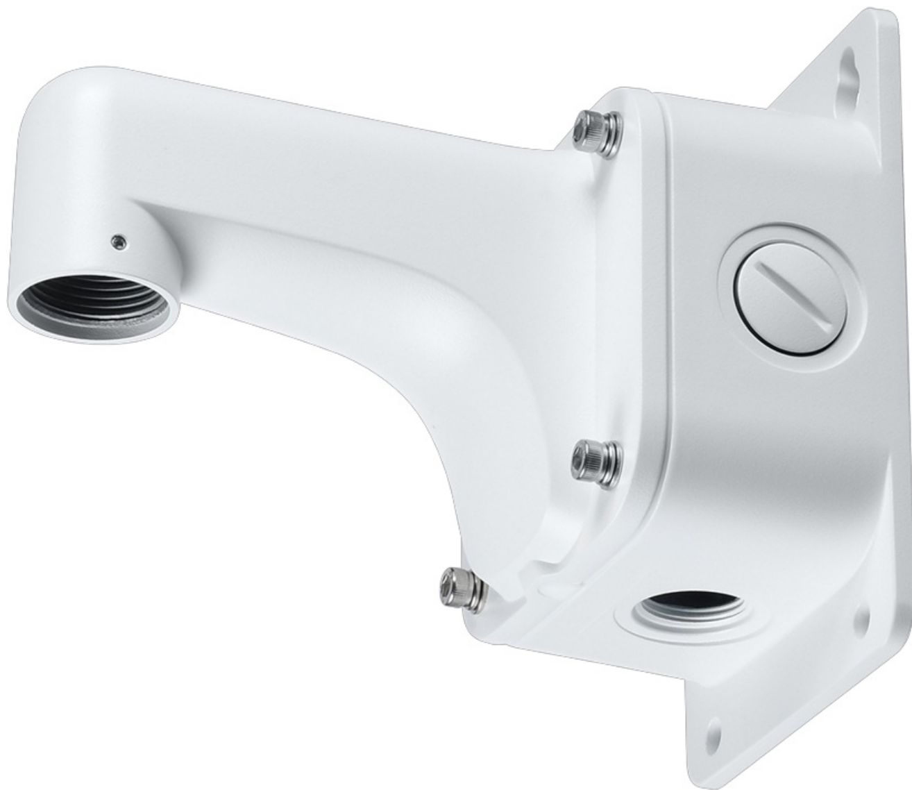
Фото RVI RVI-2BWM-2

Отправьте запрос на коммерческое предложение и получите индивидуальные цены и сроки поставки