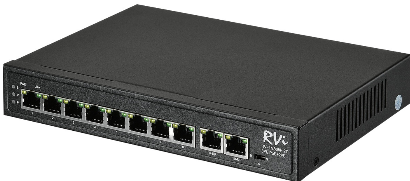
Фото RVI RVI-1NS08F-2T

Отправьте запрос на коммерческое предложение и получите индивидуальные цены и сроки поставки