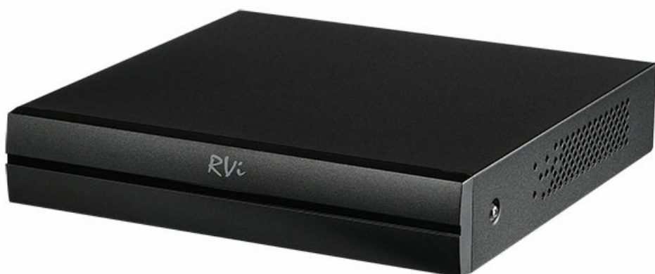
Фото Видеорегистратор RVI RVI-1HDR1041KI

Отправьте запрос на коммерческое предложение и получите индивидуальные цены и сроки поставки