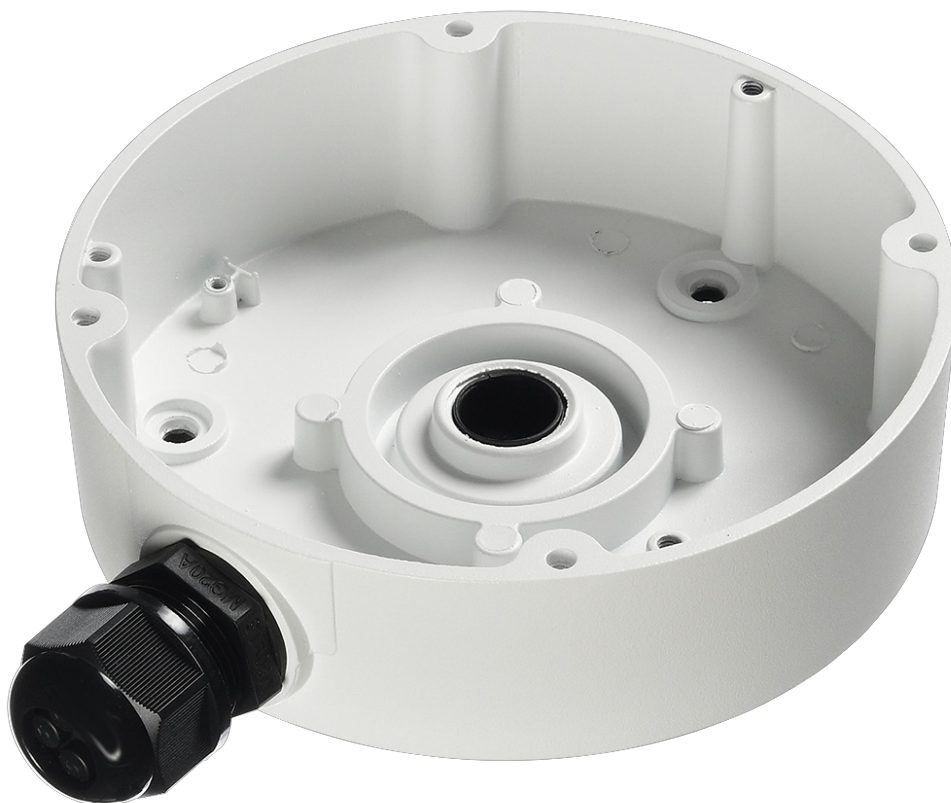
Фото RVi-1BMB-9 white

Отправьте запрос на коммерческое предложение и получите индивидуальные цены и сроки поставки