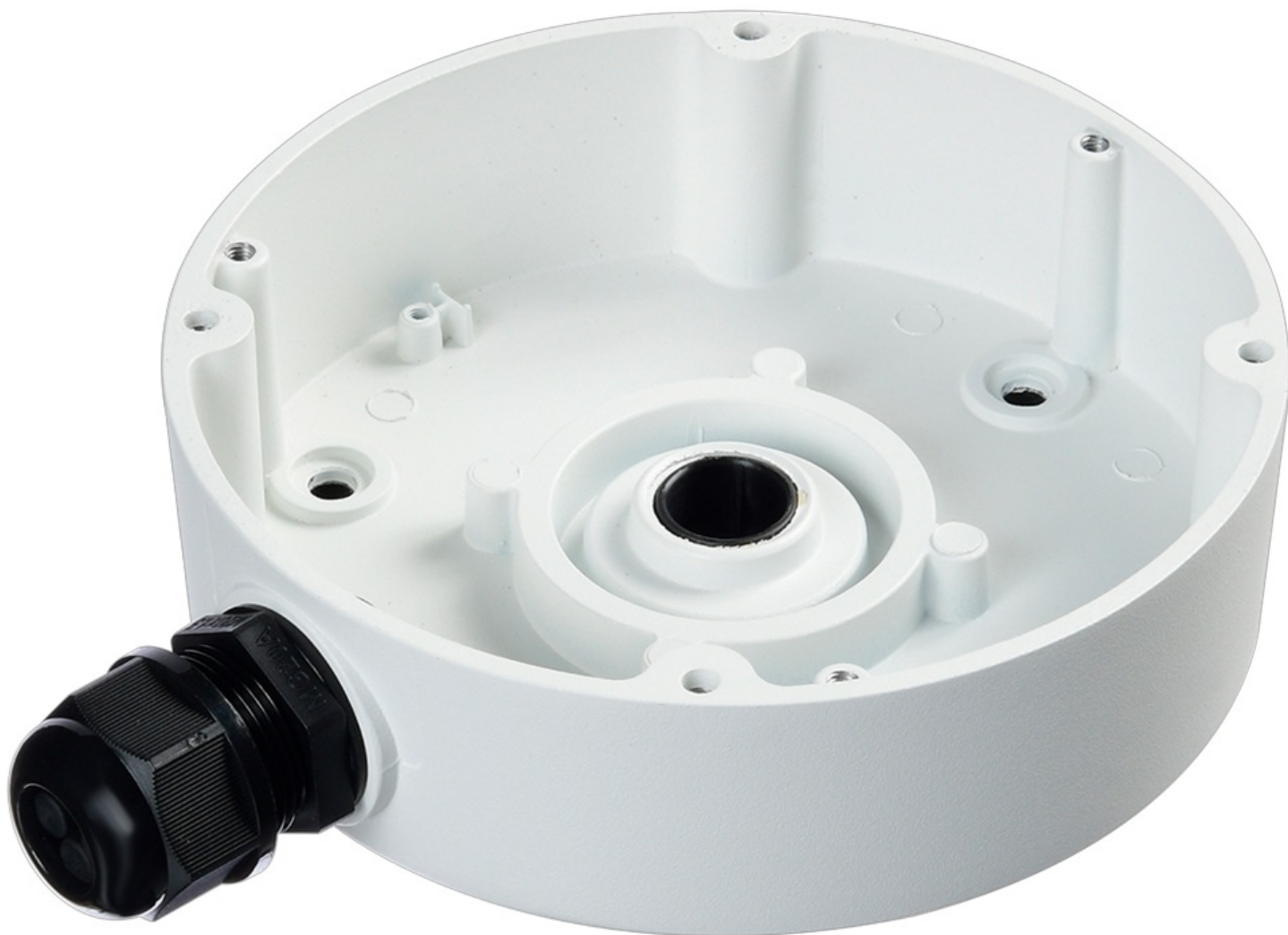
Фото RVI RVI-1BMB-9

Отправьте запрос на коммерческое предложение и получите индивидуальные цены и сроки поставки