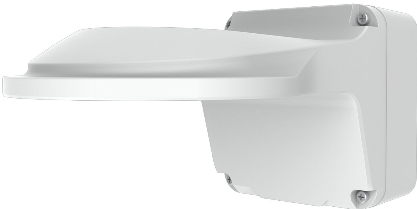
Фото RVI RVI-2BWM-9

Отправьте запрос на коммерческое предложение и получите индивидуальные цены и сроки поставки