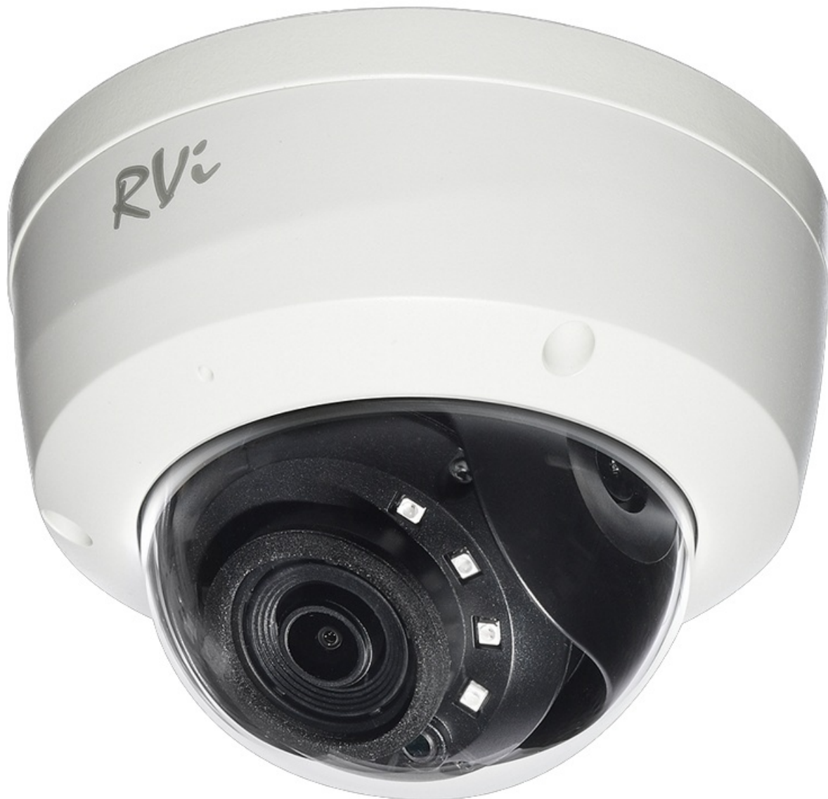
Фото RVI RVI-1NCD2024(4)WHITE IP-камера

Отправьте запрос на коммерческое предложение и получите индивидуальные цены и сроки поставки