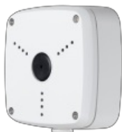
Фото RVI RVI-1BMB-3 WHITE Кронштейн

Тел: +7 495 414-25-80 | Email: sale@ru-rvi.com | https://ru-rvi.com